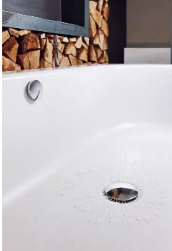
Mit der Wannengarnitur „Rotaplex Trio F“ von Viega wird die Badewanne von unten befüllt. Diese völlig neue Art des Befüllens ist besonders geräuscharm.