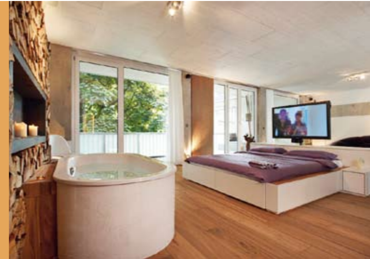
Stark im Trend: Schlafen, Wohnen und Ankleide verschmelzen zunehmend mit dem Badbereich. Wir zeigen typische Beispiele.