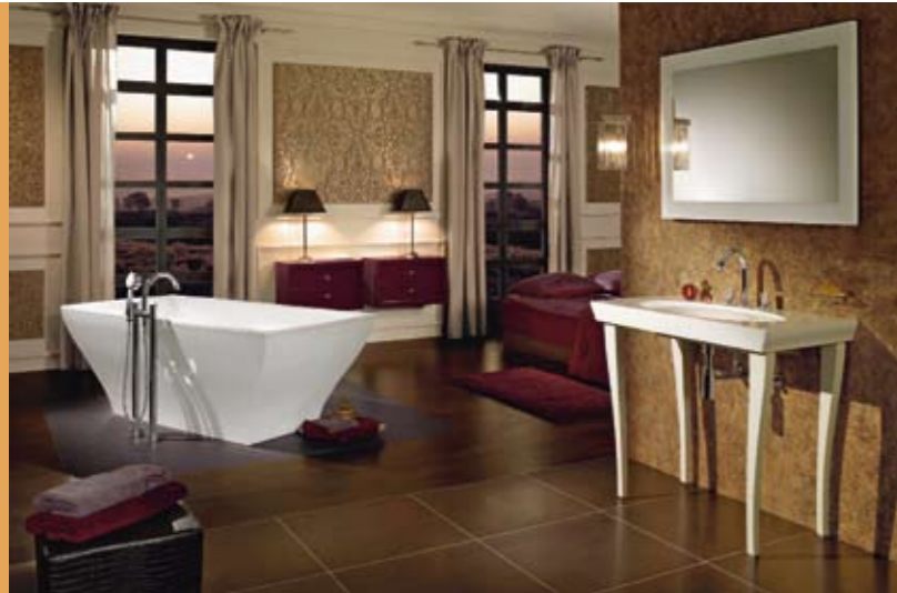
Wir stellen Ihnen in dieser Zeitschrift eine große Bandbreite vor – von opulenten Prunkbädern ...