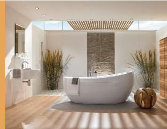
Im hektischen Alltag werden Ruhe und Rückzugsoasen immer wichtiger. Infos über Wellnessbäder finden Sie