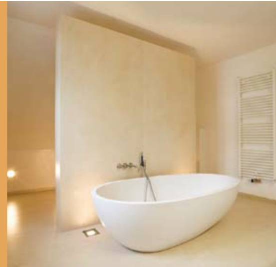
... bis hin zu puristischen Bädern, die aufs Wesentliche reduziert sind.