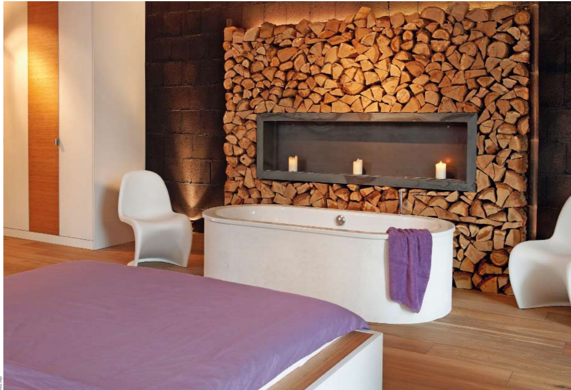
In einem offenen Schlaf-Bad-Raum schafft die freie, individuelle Anordnung von Bett, Badewanne und Kleiderschrank neue Wohn-Perspektiven.