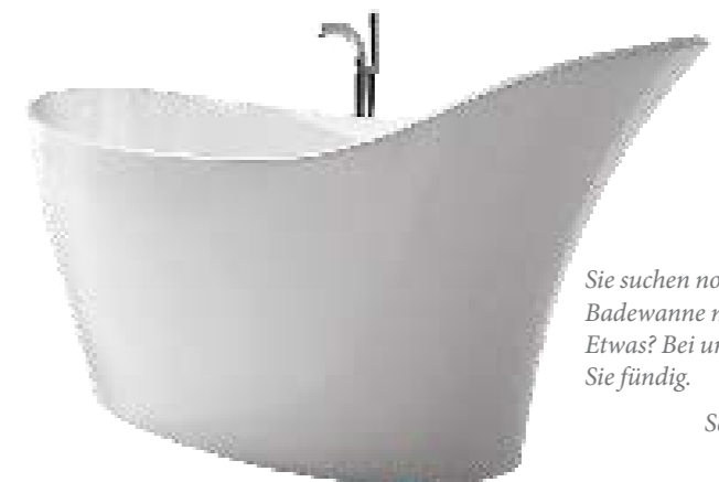
Sie suchen noch nach der Badewanne mit dem gewissen Etwas? Bei uns werden Sie fündig.